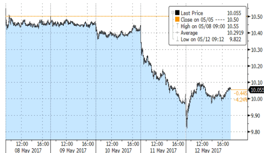
Evolución Telefónica SA (semana)

En Europa, la economía alemana crecía en el primer trimestre un 0,6% gracias a la inversión en construcción y la demanda externa, mientras que la producción industrial caía por segundo mes consecutivo por la caída de producción energética.