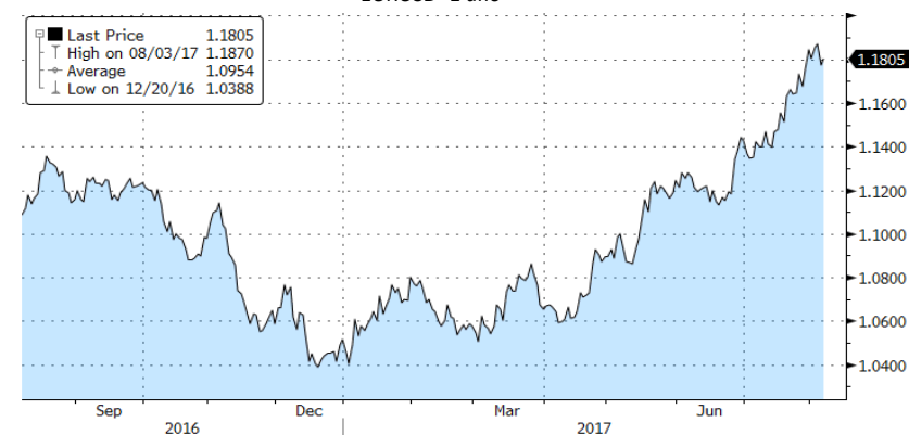
EURUSD- 1 año

Durante la semana continuó la debilidad del USD frente al EUR, que alcanzó cotas de 1,19$.