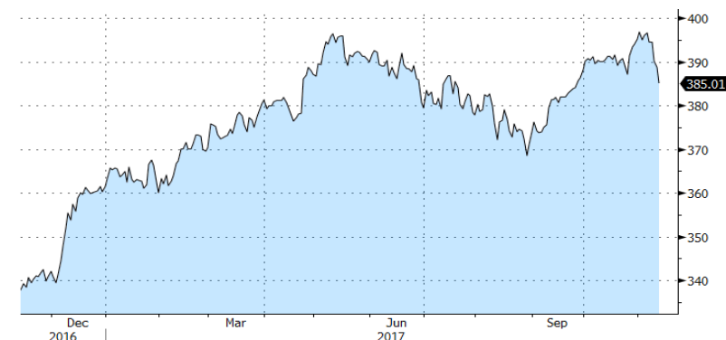
STOXX 600- 1 Y

Durante la semana entrante estaremos atentos a la publicación de datos macro: PIB 3T17, datos IPC y los últimos resultados empresariales correspondientes al tercer trimestre.