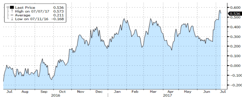
Rentabilidad Bund - 1 año

Finalmente, en Estados Unidos el PMI manufacturero registró un dato de 57,8 apoyado por producción, nuevas órdenes, y un sector laboral que incrementaba en 222.000 el número de empleados hasta dejar la tasa de desempleo en un nivel de 4,4%.