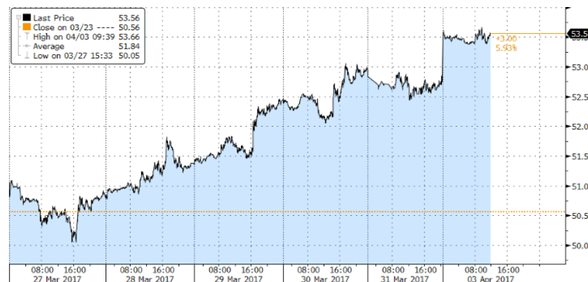
Evolución semanal de barril BRENT

Finalmente, a nivel de bancos centrales, sigue aumentando el debate sobre medidas de restricción monetaria, desde la posibilidad que el BCE suba su tipo marginal de depósito antes de final de año, hasta que la Fed empiece a reducir su balance.